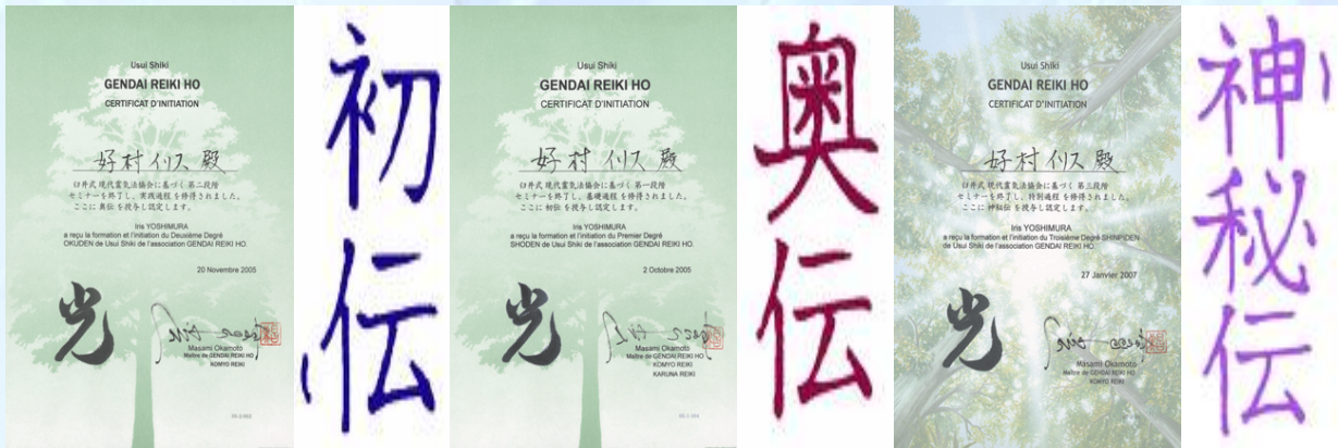
Shoden - eerste graad

De schrijver wenst de Reiki volgelings: "Blessings on your awakening and see you in the Garden".