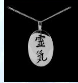
The Original Gift.nl

“Reiki is een term die in het Nederlands meestal vertaald wordt met “Universele Levenskracht”. Elk individu ervaart het op eigen wijze. Reiki is een kracht, die overal en altijd beschikbaar is voor iedereen, of elk levend wezen.” Leg hiernaast nu enkel een bijbelwoord als: niemand komt tot de Vader dan door Mij... en met betrekking tot “voor iedereen”: tenzij jij wederom geboren wordt.. En wordt God in de Bijbel de Universele levenskracht genoemd? (Diverse bronnen vereenzelvigen, zonder schroom, de God van de bijbel daarmee. Ja, één verstout het zelfs (RayKay) om hierbij te spreken over de drieënige God en de Heilige Geest daarbij dan als de vrouwelijke kant van God te benoemen. Anderen spreken over de oorsprong van alle zijn.