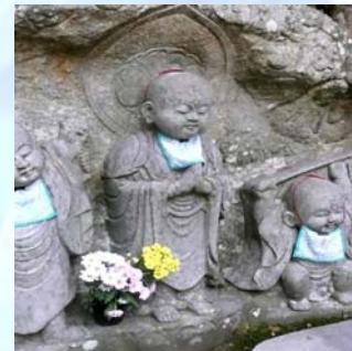
Shinto heiligdom op de Kuramayama

Wat betreft de initiatie (inwijdings-) techniek/methode van de Reiki, heet Usui terug te gaan op Mikkyo-boeddhistische technieken - dit laatste speelt met name bij de verschillende levels/graden een rol. Japanse bronnen vertellen dat Usui ruim drie jaar Zen boeddhistische training volgde in een poging om Satori (een bepaald bewustzijnsniveau corresponderend met het begrip "verlichting") te vinden. Hij schijnt zich daartoe terug getrokken te hebben op de "heilige berg" Kuramayama.